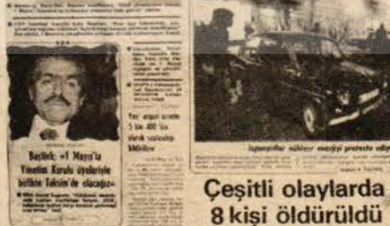
Çeşitli olaylarda 8 kişi öldürüldü