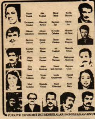
TÜRKİYE DEVİRCİ İŞÇİ SENDİKALARI KONGRESİNİNİNİ