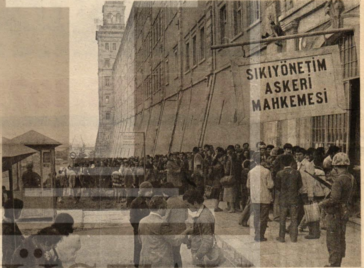
Selimiye askeri tutuk evi önünde DİSK üyesi işçiler, yöneticileri ziyaret için bekliyorlar.

kabul ettiklerini açıklamışlardır, üstelik İzmir'in sıkıyönetim kapsamı dışında kalmış olmasının 25 Nisan'da kesinleştiği ana kadar, en yetkililerinin ağızlarından, "DİSK'in kararına uyacağız" "1 Mayıs'ta 1 Mayıs Alanı'nda olacağız" demelerine rağmen